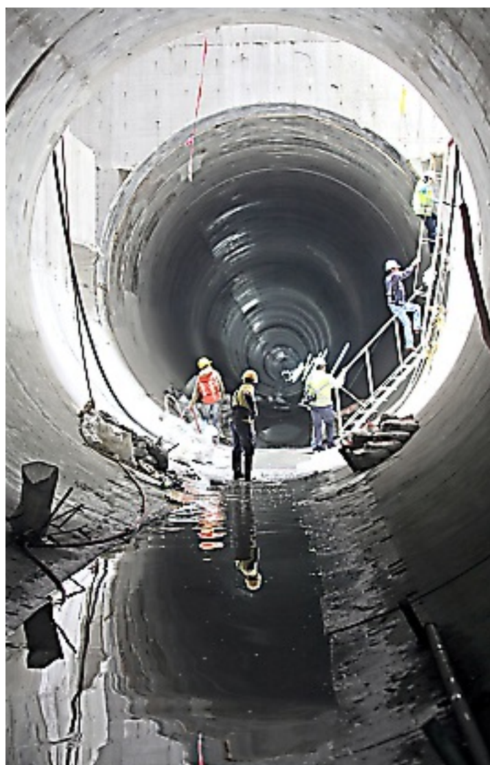
► El primer tramo que será entregado el jueves 30 de mayo va de la Lumbrera 0 a la 5 y los 52 kilómetros faltantes van de la 6 a la 24.

to, pasará por la Lumbrera 5, al final de los 10 kilómetros, en donde compuertas impedirán que se siga de frente, el agua reconocerá su trayecto hacia una