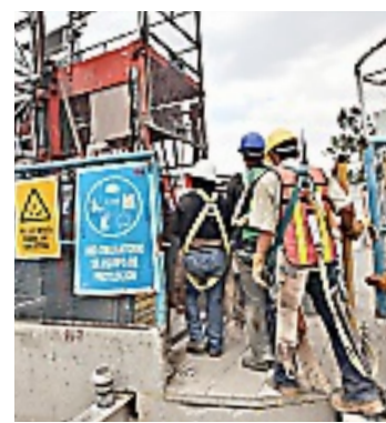
► Esta semana las lumbreras 0 a 5 serán selladas para liberar el primer tramo del TEO.

Al final de los 62 kilómetros, la Planta de Tratamiento de Aguas Residuales Atotonilco depurará las aguas negras para entregar un caudal de riego, con menores compuestos dañinos a la salud de los agricultores y riesgosos para los productos agrícolas de Hidalgo.